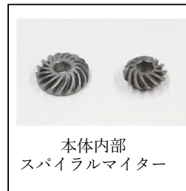
本体内部 スパイラルマイター

スタンプが不鮮明で数字が確認できない場合につきましても弊社までご連絡と商品をご送付いただきますようお願い致します。