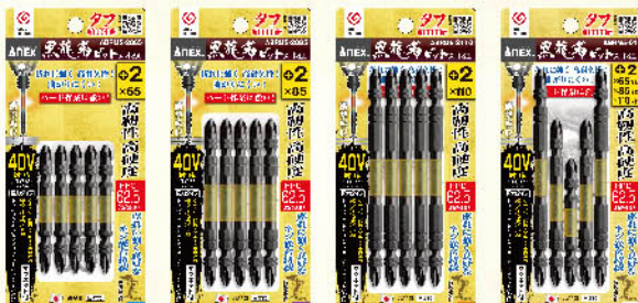
ABRM5-2065 ABRM5-2085 ABRM5-2110 ABRM5-01