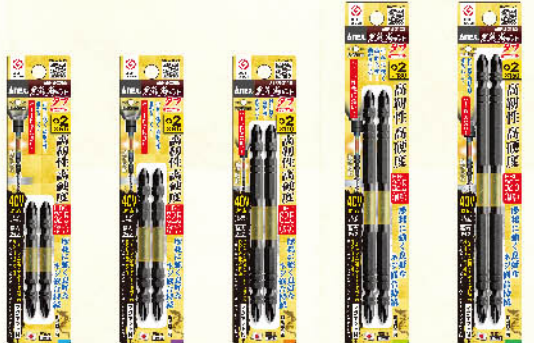
ABRM-2065 ABRM-2085 ABRM-2110 ABRM-2130 ABRM-2150