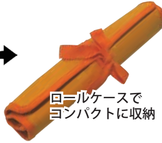
ロールケースで コンパクトに収納