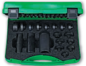
ベアリング挿入工具セット(スチール) 品番:71-K