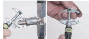
ヨーロピアン モンキーレンチ