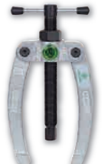
支えアーム(22シリーズ) 品番:22-1