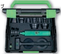
ベアリング 挿入工具セット (プラスチック)