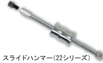
スライドハンマー(22シリーズ) 品番:22-0