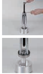
ボールベアリング プーラーセット