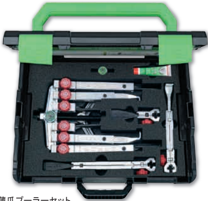
マルチ薄爪プーラーセット 品番:K-2030-10+S+T