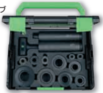
ベアリング 挿入工具セット (スチール)